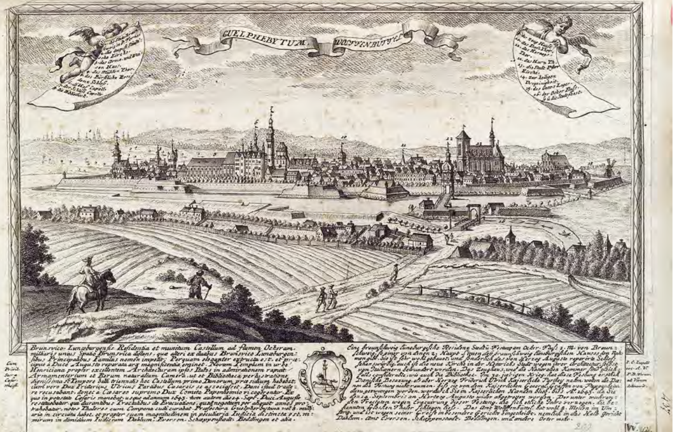
Abb. 2 Johann Christian Leopold (Verleger), Friedrich Bernhard Werner (Zeichner): Guelphetyum Wolfenbüttel. Erste Hälfte 18. Jh. Radierung/ Druckgrafik | Herzog August Bibliothek Wolfenbüttel: Top. App. 2:437

aneinandergesetzt. Denkbar ist, dass drei, wenn nicht alle vier Stadtprospekte (Braunschweig, Hannover, Celle und Wolfenbüttel) gleichzeitig hochgezogen, dann nach einer gewissen Zeit abgesenkt wurden und, über die ganze Bühne reichend, die Prolog-Szene strukturierten. Einem ›Nota bene‹ auf einem Detailblatt zur Wolfenbüttel-Vedute zufolge wird sie die hinterste Ansicht gewesen sein. Aus Gründen der Sichtbarkeit dürfte sie etwas höher als die anderen drei geschwebt haben, die ihrerseits gestuft zueinander hingen. 12