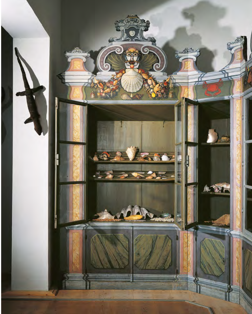
Abb. 3 Sammlungsschrank mit Conchylien in der Kunst- und Naturalienkammer der Franckeschen Stiftungen zu Halle | Halle, Franckesche Stiftungen, Foto: Klaus E. Göltz

auf Gründlers Schrank mit Alltagsgegenständen in der Mitte ein Trinkhorn platziert – wie in der Kopenhagener Vignette zu den Altertümern. Aus den Fledermäusen auf der Vignette zu den avibus werden bei Gründler, physiognomisch ähnlich, Flughund und Gleithörnchen auf dem Schrank mit Tierpräparaten, aus der japanischen Rüstung der Vignette zu den Ethnographica auf dem Schrank zu den Textilien ein türkischer Habit.