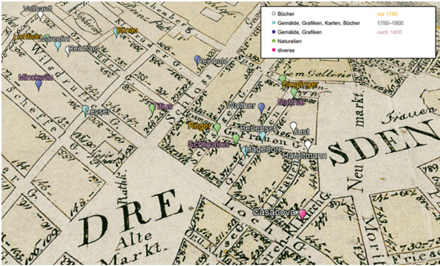
Abb. 1: Sammlungsdaten auf einer historischen Stadtkarte: »Dresdener Wegweiser oder neuentworfener Grundriß von Dresden sammt Neben- und Vorstaedten«, Kupferstich, 1813

ohne Vorauswahl oder gezielte Hervorhebung. Dadurch könnte zum einen der lokale Kontext jeder einzelnen Sammlung durch die Nähe zu Sammlungen in der Umgebung nachvollziehbar werden. Zum anderen könnten größere räumliche Muster identifiziert werden, insbesondere unter Zuhilfenahme von Filterung nach Suchbegriffen oder Kategorien. Die jeweiligen Sammlungsschwerpunkte sowie Informationen zur Zugänglichkeit könnten durch Symbole oder Farben dargestellt werden. Neben dem Gesamtüberblick erhalte man bei ausreichender Zoomstufe auch Informationen zu den einzelnen Sammlungen und entsprechende Links zu ausführlichen Datensätzen, so dass ein kontinuierlicher Übergang von distant zu close reading gegeben wäre ( blended reading ). Technische Ansätze dafür gibt es einige, alle benötigen eine passende Konfiguration oder Anpassung. 18 Als Beispiel sei hier eine Lösung mit den Tools MapWarper und GoogleEarth gezeigt (Abb. 1). 19