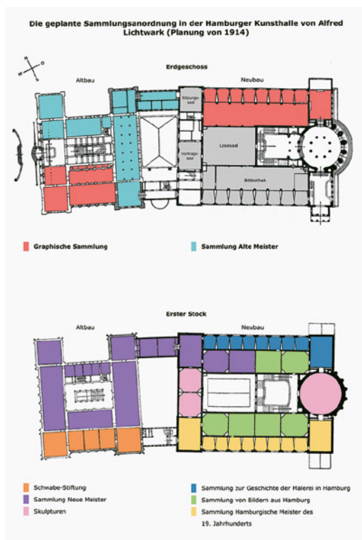
Abb. 2: Die geplante Sammlungsanordnung in der Hamburger Kunsthalle von Alfred Lichtwark (Planung von 1914)

gab es einen Übergang von der Sammlung der Hamburgischen Malerei des 19. Jahrhunderts zur Sammlung der Neuen Meister. Durch die geplante räumliche Trennung der Oberlichtsäle und Kabinette wären aber auch hier keine Sichtbezüge zwischen den Abteilungen entstanden. Die räumliche Vernetzung der Sammlungen wäre damit aufgehoben gewesen.