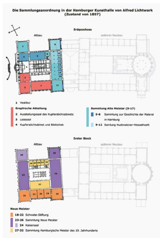
Abb. 1: Die Sammlungsanordnung in der Hamburger Kunsthalle von Alfred Lichtwark (Zustand von 1897)

die Schwabe-Sammlung. Mit der Integration der Hamburg-Sammlungen in die Kunsthalle erfolgte eine Neukonzeption der Sammlungspräsentation. 33 Im Erdgeschoss wurden die Alten Meister und das Kupferstichkabinett mit Bibliothek, Lesesaal und Ausstellungssaal untergebracht. In die Sammlung Alte Meister wurden die Sammlung zur Geschichte der Malerei in Hamburg (zwei Räume) und die Sammlung Hudtwalcker-Wesselhoft (vier Räume) eingebunden. 34 Im Obergeschoss befanden sich die Neuen Meister, die sich