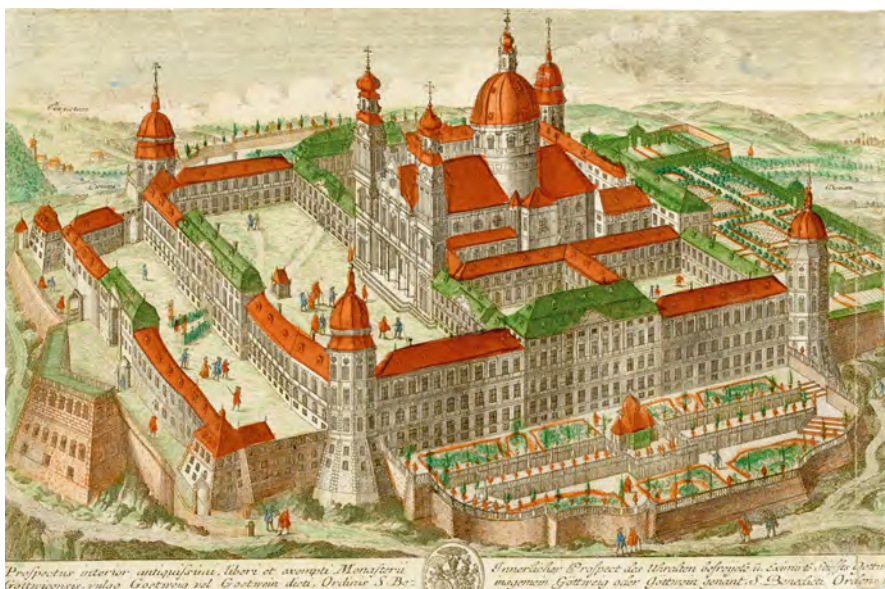
Abb. 1: Martin G. Crophius nach Friedrich B. Werner: Göttingen, 1737

Der Diarium -Bericht gehört zu den frühesten Nachrichten von der Fertigstellung der 1718 durch einen Brand schwer beschädigten und in den Folgejahren unter Abt Bessel neu errichteten Stiftsgebäude. 4