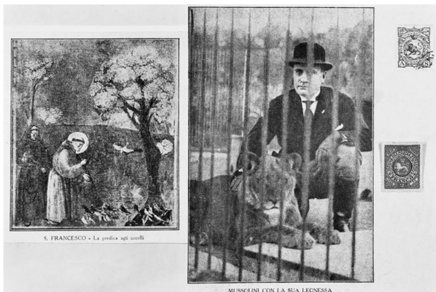
Abb. 3: Aby Warburg: Bildmontage mit Giottos Fresko »Franziskus predigt den Vögeln« (um 1296–1299), Assisi, San Francesco, einer Pressefotografie Mussolinis und seiner Löwin Europa (um 1926–1927) sowie zwei persischen Marken mit Löwenwappen (spätes 19. Jh. und 1927)

fascies in der modernen italienischen Staatssymbolik.« 28 Damit unternimmt es Warburg, die Wortgeschichte des von Fascies abgeleiteten Faschismus gleichsam bildgeschichtlich zu untermalen und dadurch Rothackers methodischen Ansatz zu erweitern und zu konterkarieren. Das Rutenbündel beschreibt Warburg »als eine Art externen Körpergliedes [...], das seinen Trägern ein omnipotentes Bewußtsein verleihe und von ihm als Signum einer ›erweiterten Cheirokratie‹, einer handfesten Herrschaft gewalttätiger Massen, bezeichnet wird.« 29 Unter anderem verwendet Warburg auf seiner Bildtafel zeitgenössische, von ihm als ›Bilderfahrzeuge‹ verstandene Briefmarken, durch deren graphische Oberfläche (Grisaillentechnik), wie Ernst H. Gombrich beobachtete, das ›Anführungszeichen‹ der bildenden Kunst mit transportiert wurde. 30 In der Vereinnahmung der Motive des Rutenbündels und des Beils durch die italienischen Faschisten werden diese Mo-