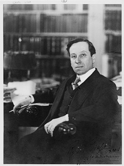
Abb. 1: Robert Eisler 1925 in Paris

Kapitalismus als Religion (Walter Benjamin, 1921) – als den unbewussten Zusammenhang von Schuldenmachen und Schuld in Verlängerung zu und gleichzeitiger Konkurrenz mit dem Christentum – versprache. 56 Auch seine kurze Tätigkeit 1925 in Paris, als er stellvertretender Sekretariatschef des Völkerbundinstituts für geistige Zusammenarbeit wurde, übergehe ich. 57 Erwähnen möchte ich nur, dass das Foto Eislers, das ich hier abbilde, aus dieser Lebensphase stammt. Es zeigt ihn am Schreibtisch seiner Pariser Wohnung und war, mit einer Widmung versehen, ein Geschenk für Scholem. 58