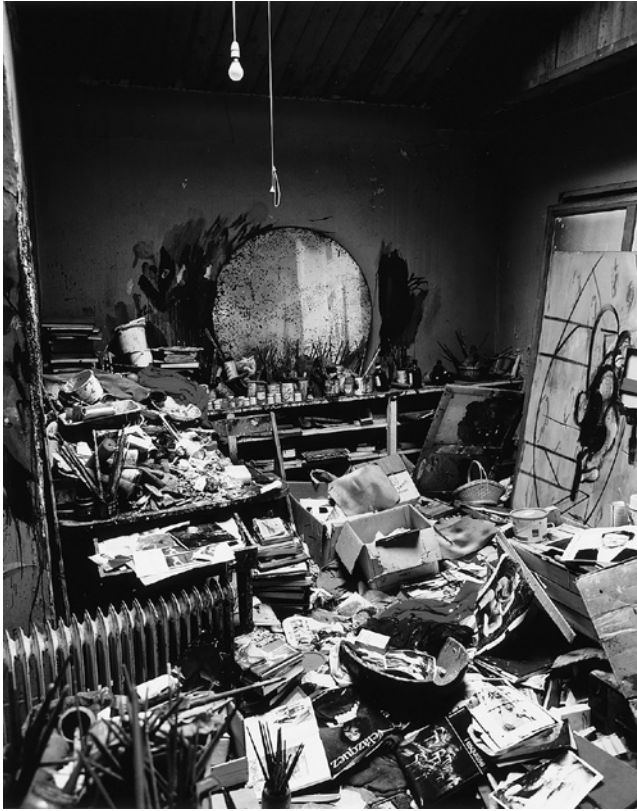
Abb. 1: Perry Ogden, Francis Bacons Atelier in 7 Reece Mews, 1998.

maß wechselndes Bildmaterial auf Tischen und Regalen oder lag verstreut auf dem Boden. 5 1961 bezog Bacon ein Atelier in 7 Reece Mews in South Kensington und lebte und arbeitete dort bis zu seinem Tod. 1998 wurde das gesamte Atelier samt seinen farbverschmierten Wänden in die Dublin City Gallery The Hugh Lane verbracht. Dort ist der rekonstruierte Raum seit 2001 ausgestellt; das originale Arbeitsmaterial ist in den Archivräumen einsehbar.