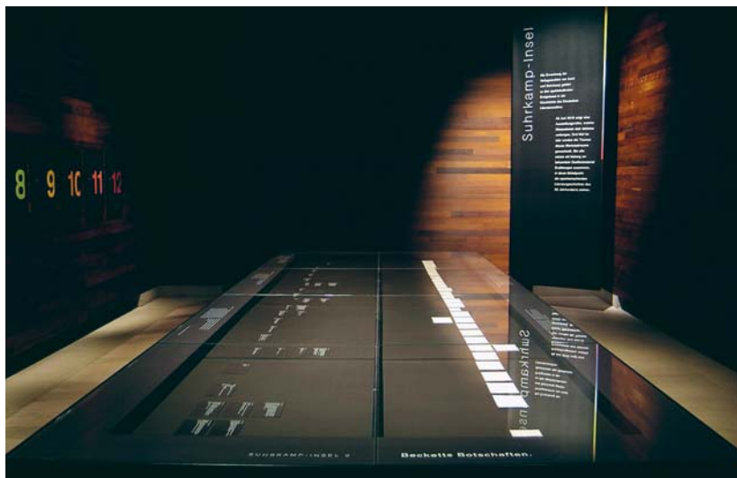
Suhrkamp-Insel »Becketts Botschaften«

Damals fiel mir sein erster Roman in die Hände, das war Murphy . Ich habe das Buch aufgeschlagen und las den ersten Satz, den ich nie vergessen werde: »Die Sonne schien, da sie keine andere Wahl hatte, auf nichts Neues.« Ich musste sofort lachen und dachte: großartig, unglaublich! Und hielt den Autor zunächst einmal einige Jahre lang für einen Humoristen. In der Tat, auch die folgenden Romane, Der Namenlose und Molloy , das sind natürlich nicht nur, aber unter anderem auch humoristische Romane. Das sind außerdem natürlich hochgradig philosophische Romane, insbesondere existenzialistische Romane. Aber sie sind immer auch komisch. Bis heute habe ich nicht herausgefunden, wie man die Anteile sozusagen sortieren kann. Vermutlich sollte man das auch gar nicht, das ist mein letzter Stand der Überlegungen. Auch seine Stücke sind ja immer todernst und komisch zugleich.