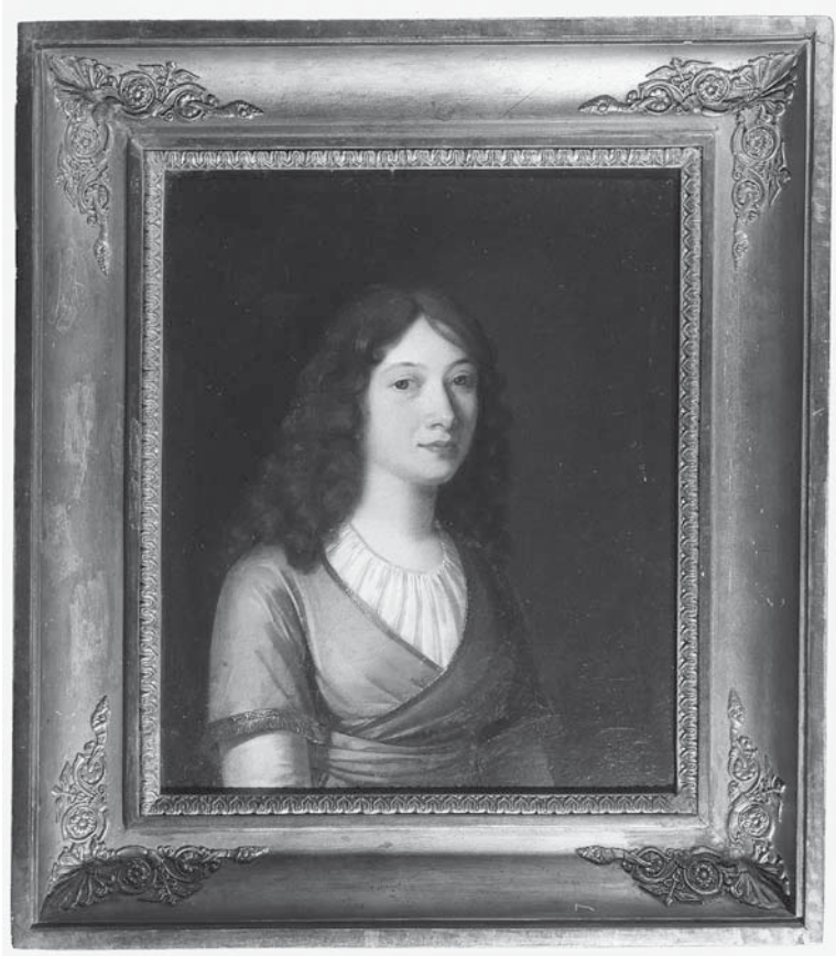
Abb. 2: Charlotte Schiller, 1794 Ölgemälde von Ludovike Simanowiz

drei kleineren Charlotten-Porträts, die kurz nacheinander zwischen 1856 und 1860 der Öffentlichkeit zugänglich gemacht wurden, durchaus folgenreich. Sie nämlich sind es gewesen, die das Bild Charlotte Schillers im neunzehnten Jahrhundert nahezu ausschließlich und noch im vergangenen Jahrhundert maßgeblich geprägt haben. Im Scherenschnitt fand man den mädchenhaften Reiz der Jugend, in der Zeichnung den anmutigen Ernst der jungen Frau und im Brustbild schließlich die vertraute Gefährtin des berühmten Mannes. Das nahezu ganzfigurige Gemälde, das eine selbstbewusste Charlotte Schiller bei der Lektüre zeigt, wurde dagegen selbst noch im zwanzigsten Jahrhundert nur zögerlich beachtet. Erst heute zählen die Pendantporträts von Charlotte und Friedrich Schiller zu