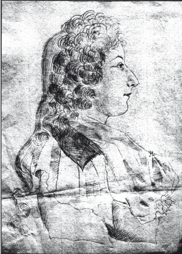
Abb. 5: Charlotte Schiller, 1788

Zeichnung von Prinz Ludwig Friedrich von Schwarzburg-Rudolstadt (photographische Dokumentation des verschollenen Originals Thüringer Landesmuseum Rudolstadt)