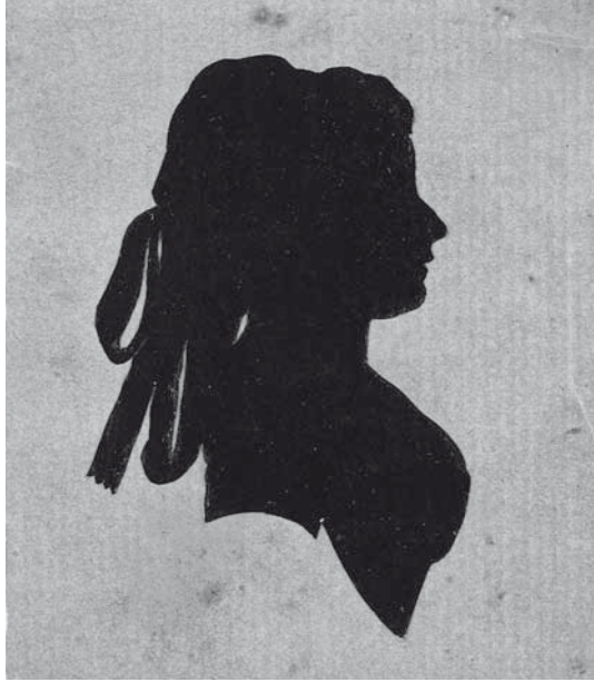
Abb. 3: Charlotte Schiller, 1784 Scherenschnitt von Unbekannt

den entscheidenden Quellen nicht nur für die äußere Erscheinung des Dichters und seiner Frau, sondern auch für ihr Selbstverständnis als intellektuelle Lebensgemeinschaft.