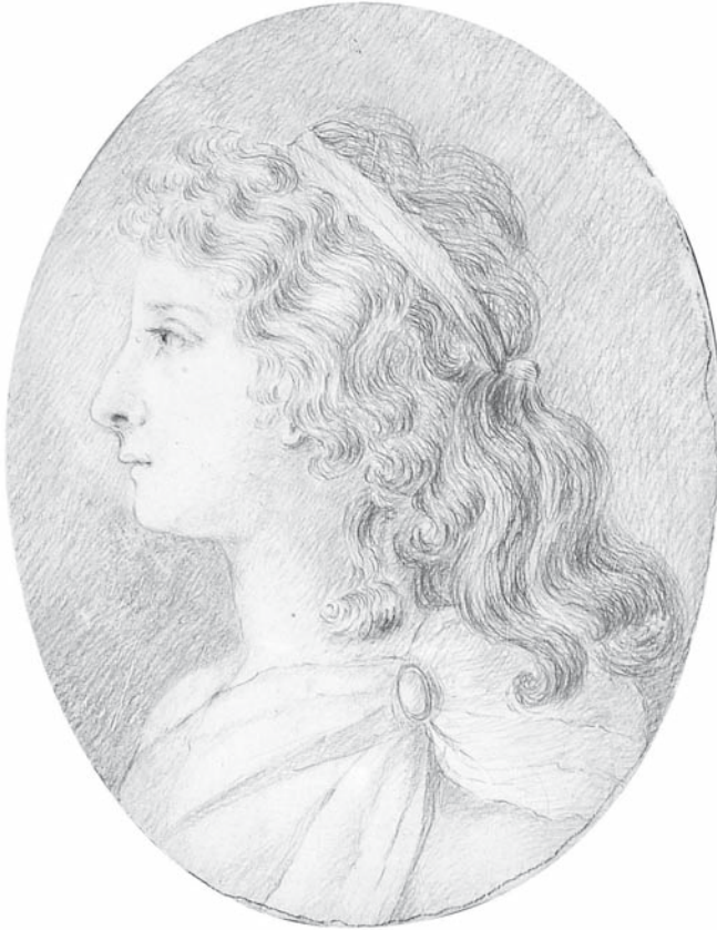
Abb. 4: Charlotte Schiller, 1790 Silberstiftzeichnung von Charlotte von Stein

genauer betrachtet wurde. 4 Es soll deshalb im Folgenden um zweierlei gehen: um die Frage, ob auf all diesen Bildnissen tatsächlich Charlotte Schiller 5 wiedergegeben ist und um den Nachweis, dass der Veröffentlichung der kanonisch