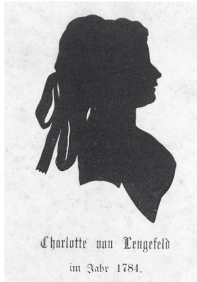
Abb. 10: Charlotte Schiller, 1860 Lithographie von Unbekannt nach dem Scherenschnitt von 1784, Frontispiz in Charlotte Schiller und ihre Freunde , Bd. 1, Stuttgart 1860